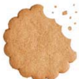
El forn del lleó, un espectacle per llepar-se els dits